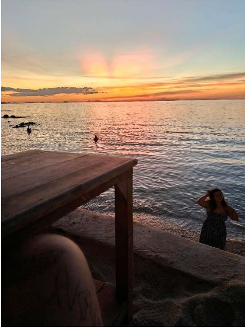
Abbildung 9 - No words needed