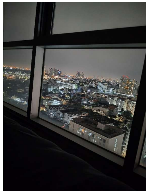
Abbildung 2 - Blick aus Air BnB

In den ersten Wochen habe ich in einer Wohnung etwa 4 km von der Universität entfernt gewohnt. Gefunden habe ich sie über Airbnb, die Kosten lagen bei ca. 530 € pro Monat. Die Anlage war sehr angenehm: schöne Aussicht, ein Pool, und im Erdgeschoss gab es eine Bibliothek, die man nutzen konnte. Insgesamt war ich knapp 60 Tage dort.