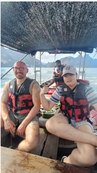
Abbildung 7 - Boat ride Kaho Soik

Außerdem habe ich mehrere Muay-Thai-Events besucht: von kleinen Kämpfen unter freiem Himmel bis hin zu großen Veranstaltungen im Rajadamnern Stadium und Events von ONE Championship. Das war sportlich und atmosphärisch ein echtes Highlight.