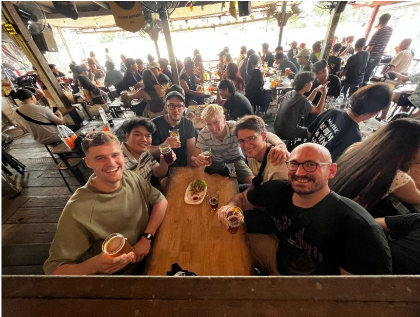
Abbildung 6 - Refreshing Trip

Kontakte Innerhalb der Hochschule war das Dorm mein wichtigster Kontaktpunkt: Man lernt schnell andere Austauschstudierende kennen, und es ergeben sich leicht gemeinsame Aktivitäten. Zusätzlich habe ich über das Semester auch thailändische Studierende kennengelernt, was für mich besonders wertvoll war, weil man dadurch mehr vom Alltag außerhalb der