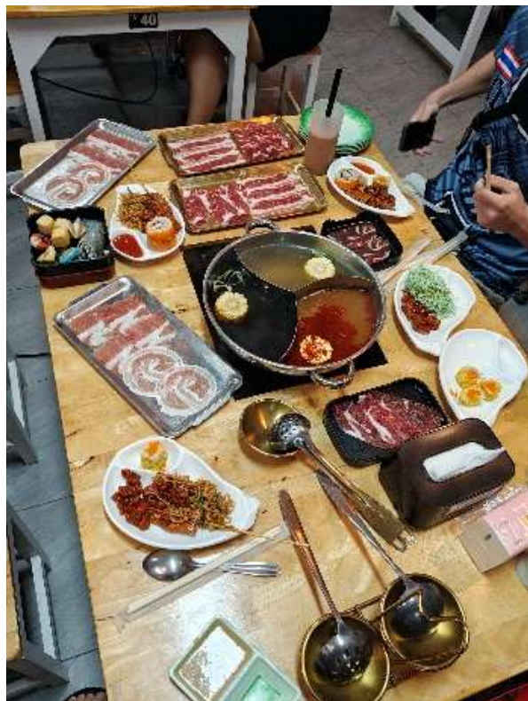
Abbildung 8 - Hot Pot MUST TRY!

Am stärksten in Erinnerung bleiben mir die gemeinsamen Unternehmungen mit Mitstudierenden und besonders der Roadtrip mit meinem thailändischen Freund (Gong). Dadurch habe ich Land, Leute und Essen deutlich intensiver kennengelernt als es über klassische Ausflüge möglich gewesen wäre.