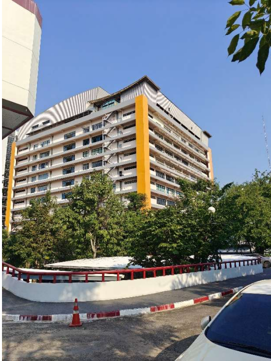
Abbildung 3 - 40th Anniversary Bulding with Dorm

Nach rund zwei Monaten bin ich in das Wohnheim der KMUTNB gezogen (40th Anniversary Building auf dem Campus). Das Zimmer war zweckmäßig, ca. 8 m 2 groß, allerdings ohne Außenfenster, weil die Zimmer mit Fenster bereits belegt waren. Mein Tipp: Wenn man ins Dorm möchte, möglichst früh nach einem Zimmer mit Außenfenster bzw. besserer Lage fragen.