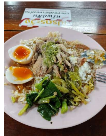
Abbildung 4 - Khao Mhoo

Die Kurswahl soll offiziell frühzeitig erfolgen, in der Praxis entscheidet sich jedoch vieles erst vor Ort in Bangkok. Bei mir sind Kurse, die zunächst wählbar waren, wegen zu geringer Teilnehmerzahlen nicht zustande gekommen. Dadurch musste ich meinen Stundenplan nach Ankunft noch einmal anpassen.