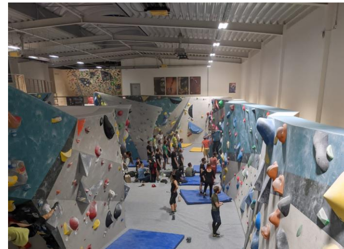
Boulderhalle Hangar Brno