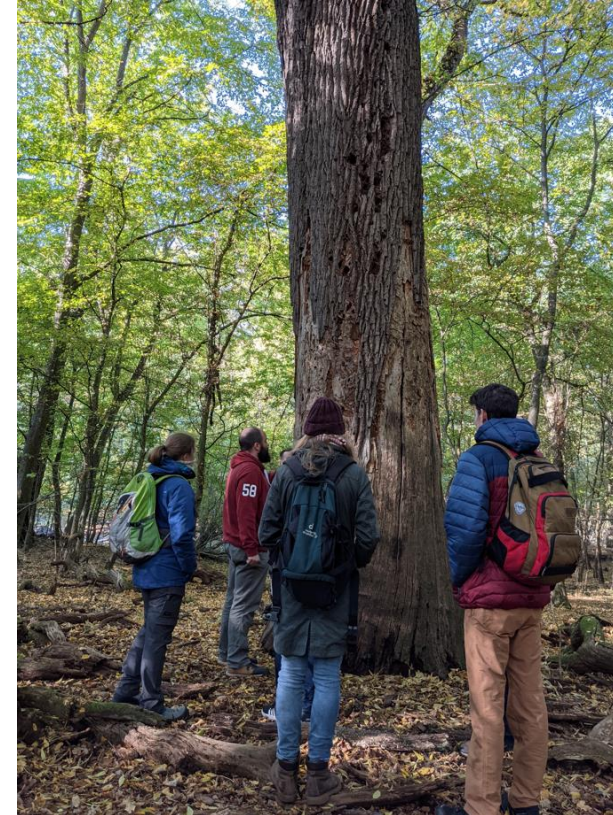
- Exkursion in die Umliegenden Wälder