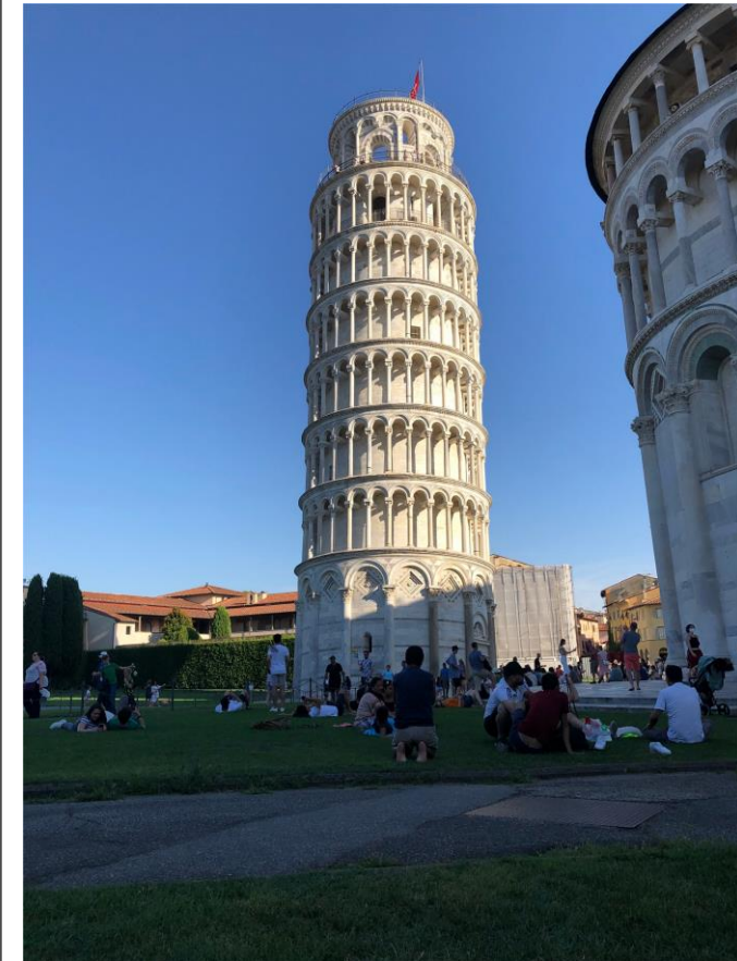
(Das Markenzeichen von Pisa – der schiefe Turm)

Das Bewerbungsverfahren verlief reibungslos online und es wurden keine besonderen Vorkenntnisse gefordert. Nur ganz nach der italienischen Gelassenheit habe ich erst ein paar Tage vor dem Start die Informationen zum Ablauf der Sommer School bekommen.