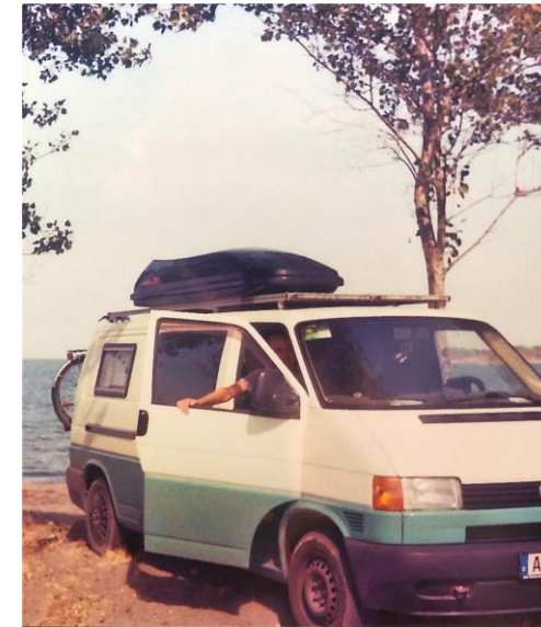
(Meine Unterkunft auf vier Rädern)

Da ich selbst mit meinem VW-Bus anreiste, hatte ich keine Schwierigkeiten beim Finden einer Unterkunft. Direkt am Rand der Stadt habe ich einen Platz auf einem Campingplatz bekommen. Und das Beste: Ich hatte mein Fahrrad dabei. Somit konnte ich in nur 3 Minuten zum Schiefen Turm und in 5 Minuten zur Universität radeln. Ich hatte keine Anforderungen an die Unterkunft, da ich nur die Zeit zum Schlafen dort verbrachte.