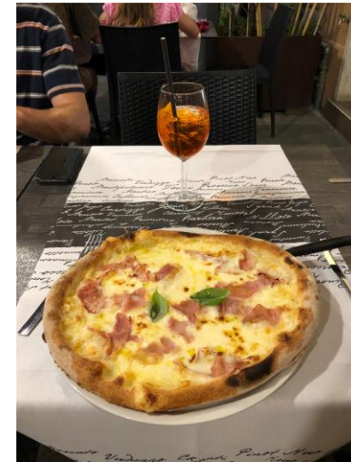
(Das beste Abendessen – Pizza und Aperol)

Ich kann jedem nur ans Herz legen, so eine Erfahrung zu machen.