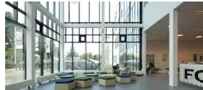
Eingangsbereich der Fontys Hogeschool