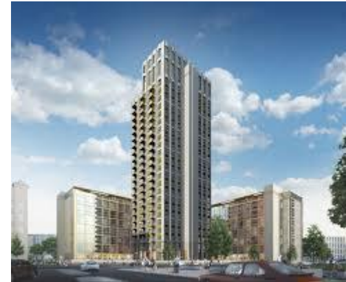
Onyx Tower in Eindhoven

Das 3. Semester an der deutschen und niederländischen Hochschule haben sich dennoch sehr unterschieden, sodass ich nur 2 Fächer anrechnen lassen konnte.