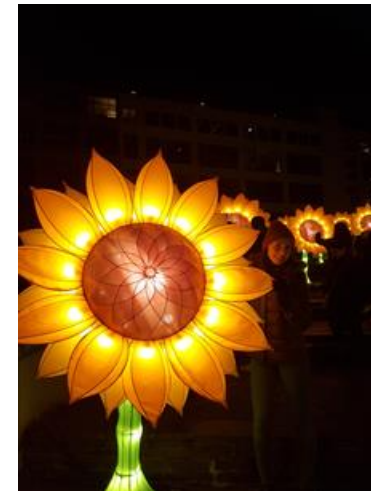
Lichterfest in Eindhoven