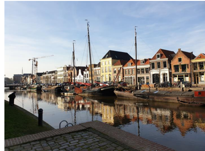
Kanäle in Zwolle