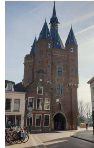
Sassenport in Zwolle

Talenteplein und Leliestraat: Diese zwei Wohnheime sind relativ zentral gelegen und sowohl der Weg in die Innenstadt als auch in die Uni ist nicht weit. In beiden Wohnheimen teilen sich immer 2 Studenten ein Zimmer. Die Zimmer sind voll ausgestattet mit Möbeln (Betten, Tisch, Regal, Schrank), kleiner Küchenzeile und einem Bad.