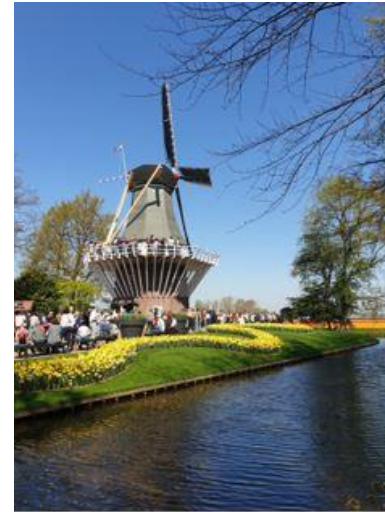
The Keukenhof – Tulpenpark in der Nähe von Amsterdam

Mein Fazit über dieses Auslandssemester ist absolut positiv!! Die 5 Monate in Holland sind wie im Fluge vergangen und am Ende war es sehr hart meine neue Heimat und all die tollen Menschen wieder zu verlassen. Ich würde jedem ein Auslandssemester und auch die UAS Windesheim in Zwolle empfehlen!!