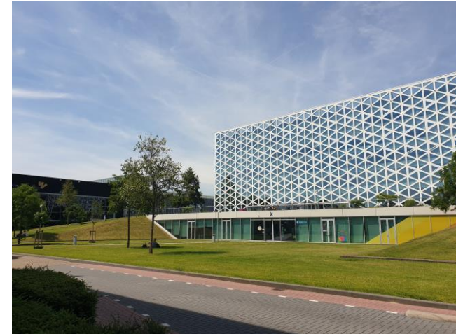
Campus der UAS Windesheim

Die UAS Windesheim ist mit gut 20.000 Studenten um einiges größer als die TH Rosenheim, aber sehr gut und modern ausgestattet. Ohne Laptops geht in den Vorlesungen gar nichts, es gibt mehrere Kantinen und auch ein großes Sportangebot mit eigenem Fitnessstudio, Kletterhalle und Schwimmbad.