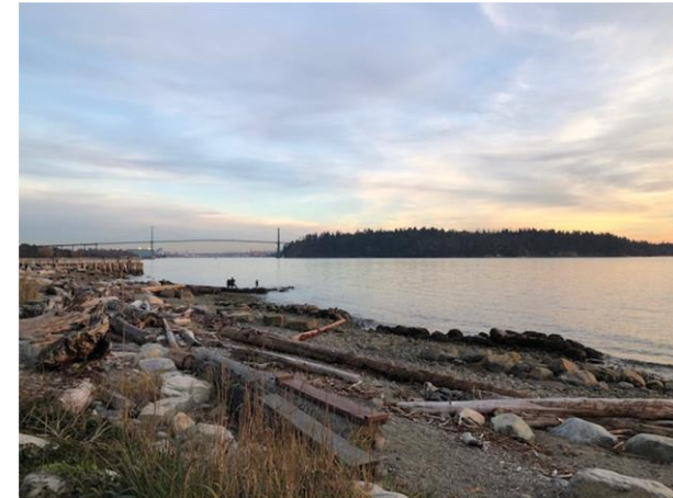
West Vancouver Ambelside

Es empfiehlt sich unabhängig davon einen internationalen Führerschein ausstellen zu lassen.