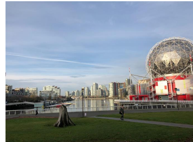
Science World in Forest Creek

Lauten Woodworking Ltd. wurde von zwei Geschäftsführern 2006 in North Vancouver gegründet. Sie haben sich mit ihrem Team aus 16 Mitarbeitern auf den hochwertigen Innenausbau von Privathäusern spezialisiert. Die Aufträge werden zu 90% vom Architekten oder Designer vergeben, demzufolge man selten direkt mit einem Kunden zu tun hat. Meine Tätigkeitsfelder im Praktikum waren, dass kurz zuvor eingeführte ERP-System in den Arbeitsalltag zu integrieren. Im genaueren war ich verantwortlich das Zeitmanagement zu optimieren und die Betriebsorganisation unter Absprache mit den Geschäftsführern zu steuern. Weitere Aufgaben waren die Lagerhaltung und Kommissionierung auszuführen aber auch einige eigene Projekte von Anfang bis Ende zu planen und betreuen. Es war daher sehr interessant eine abwechslungsreiche Tätigkeit zu ausüben, in der ich mit Menschen zusammenarbeiten musste, um gemeinsam ein Ziel zu erreichen und im gleichen Zuge die wirtschaftliche Seite der Projekte näher kennen zu lernen.