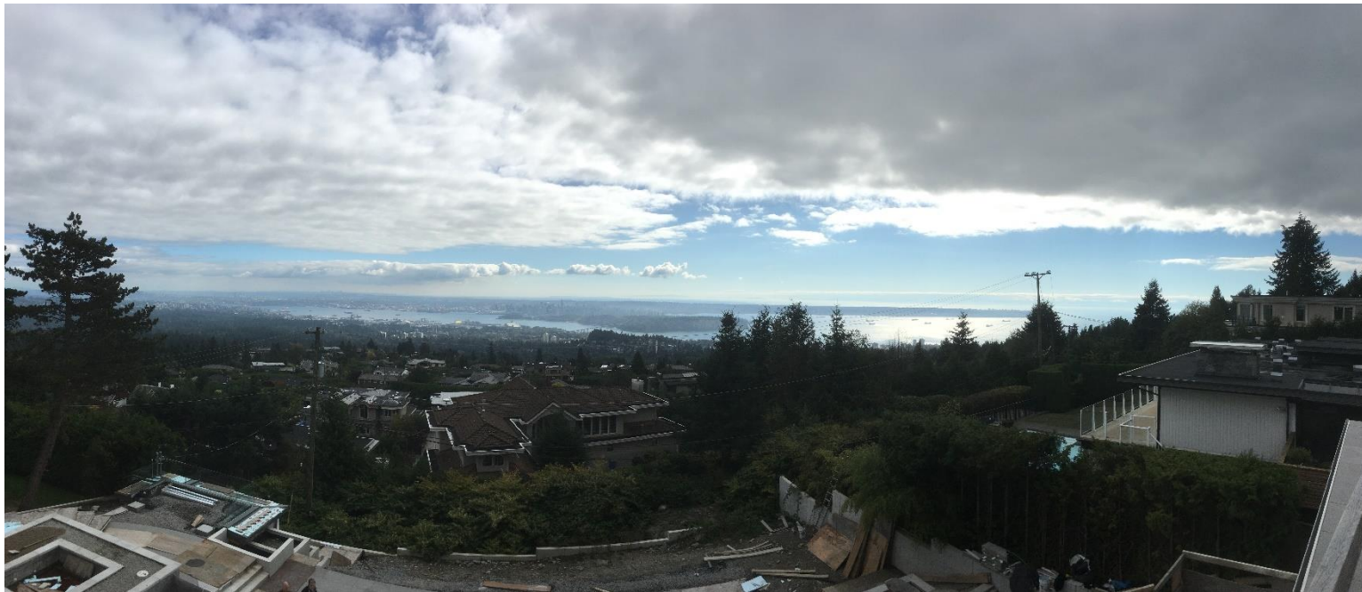
Ausblick auf den Stanley Park und Downtown von West Vancouver

Auch wer der englischen Sprache weniger mächtig ist, findet seinen Weg durch das praktische Anwenden und Umsetzen der Aufgaben, die täglich im Unternehmen oder privat zu bewältigen sind.