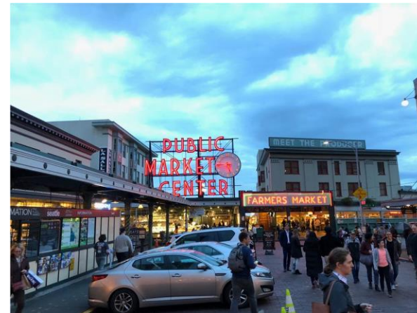
Seattle Public Market