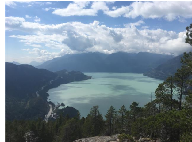
Stawamus Chief Provincial Park