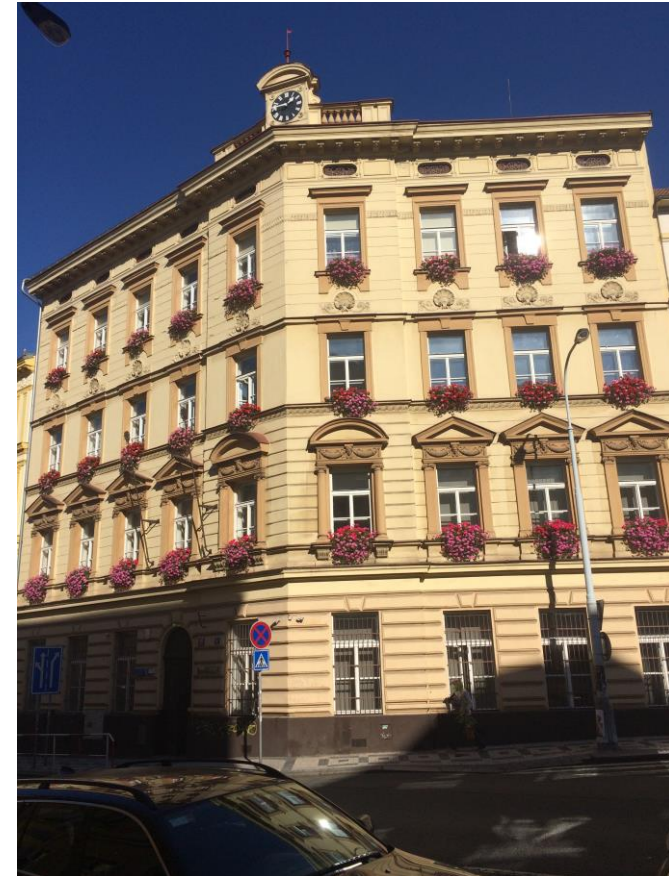
Eines der Unigebäude

Die Einschreibung ist sehr einfach und es wird auch alles möglich gemacht damit die Studenten aus aller Welt, das studieren können was sie wollen/müssen/brauchen. Eine Mensa gibt es leider nicht, aber da das Essengehen abseits des Zentrums nach wie vor sehr günstig ist, hat mich das nicht weiter gestört. Die 3 verschiedenen Campus liegen etwas auseinander und es ist nicht immer ganz so schnell möglich von einem zum anderen zu gelangen, aber auch das hat man irgendwann raus. Die MUP hat ein tolles und günstiges Sportangebot, bei dem man auch super in Kontakt mit Tschechen kommt.