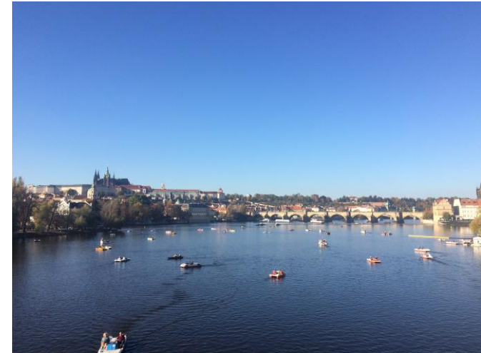
Karlsbrücke und die Prage Burg

Sobald ich die Zusage von der Metropolitan University Prague hatte lief auch hier der Kontakt sehr gut. Man wurde zur rechten Zeit mit den entsprechend wichtigen Informationen versorgt und hatte auch immer die Möglichkeit mehrere Ansprechpartner bei Fragen zu kontaktieren.