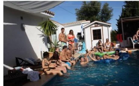
Poolparty in Fuengirola