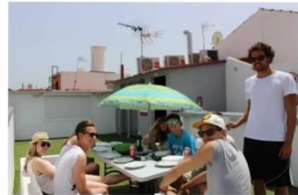
Dachterrasse meiner Wohnung

Es gab eine Infoveranstaltung am Anfang des Semester, an der alle Erasmusstudenten anwesend sein mussten. Man hatte alles erklärt bekommen, was zu tun ist wegen der Belegung der Fächer usw. Schlussendlich war die Einschreibung und Belegung von Fächern kein Problem. Die Lehrveranstaltungen, die ich belegt habe, waren einheitlich gegliedert und verständlich. Zu Beginn hat die Universität ein Spanischkurs angeboten, den die meisten Studenten auch besucht haben. Der Kurs dauerte 4 Wochen und hat mir sehr weitergeholfen mit meinem Spanisch.