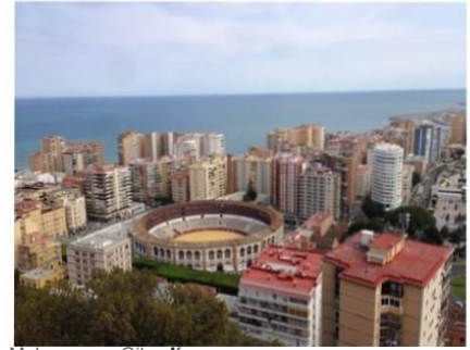
Malaga vom Gibralfare