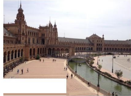
Sevilla- Plaza España

Das Semester in Malaga war eines der besten Erfahrungen, die ich je gemacht habe. Ich habe viele Leute aus verschiedensten Ländern kennengelernt und richtig gute Freunde gefunden. Ich würde jedem empfehlen ein Erasmus Semester zu machen und speziell in Malaga.